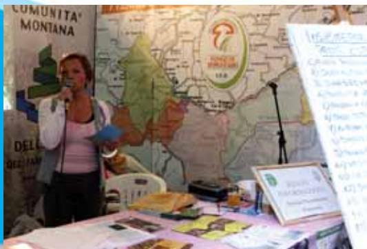
Estrazione lotteria "Insieme per vivere" 2007