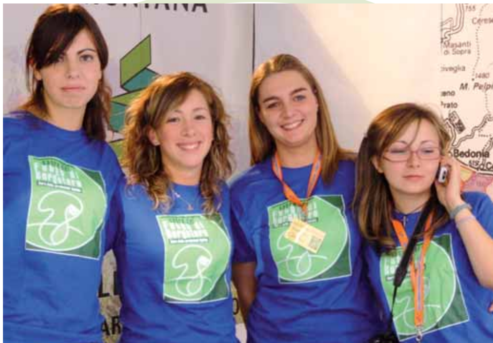
Ragazze dello Stand Informazioni Turistiche - Sagra 2007

BORGO VAL DI TARO 19-20-21 / 26-27-28 SETTEMBRE 2008